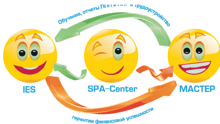
Схема 2. Система взаимодействия

2. Обучение будет лицензионным, то есть программа будет утверждена государством.